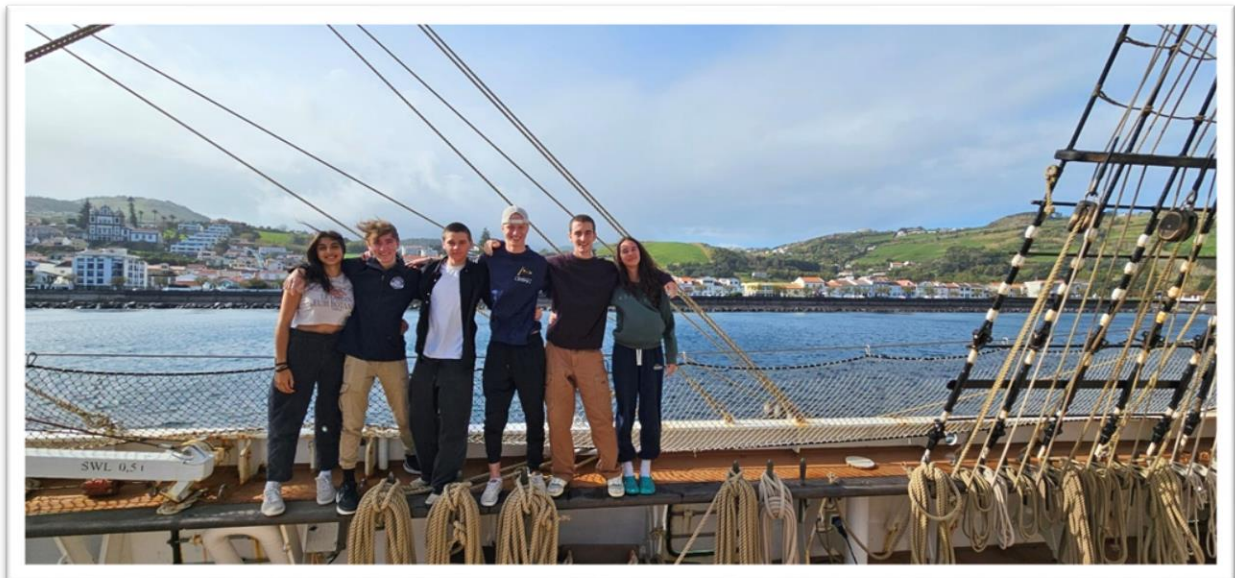
(Unsere neuen Floatie-Leichtmatrosen in Horta)